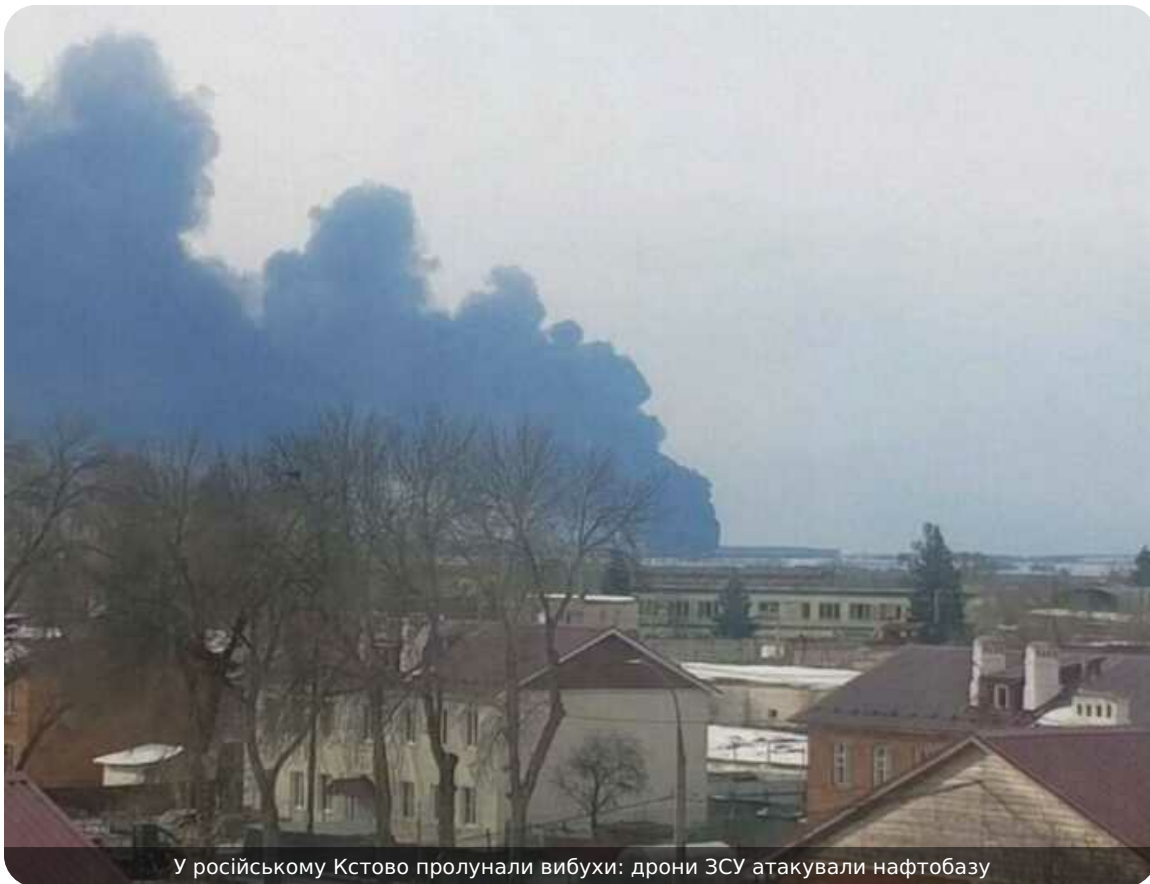
У російському Кстово пролунали вибухи: дрони ЗСУ атакували нафтобазу

У ніч на 23 квітня в Нижньогородській області РФ прогрімала серія вибухів. За попередньою інформацією, у місті Кстово українські безпілотники атакували нафтобазу.