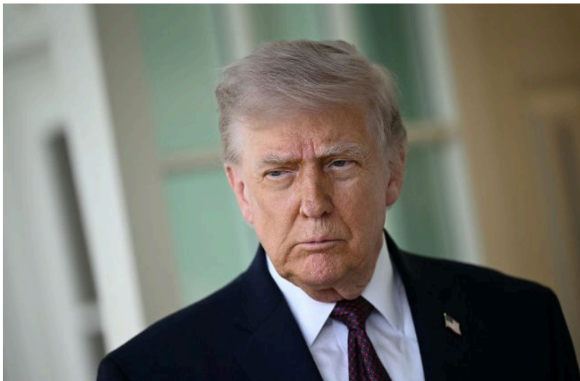
Фото: Дональд Трамп, президент США