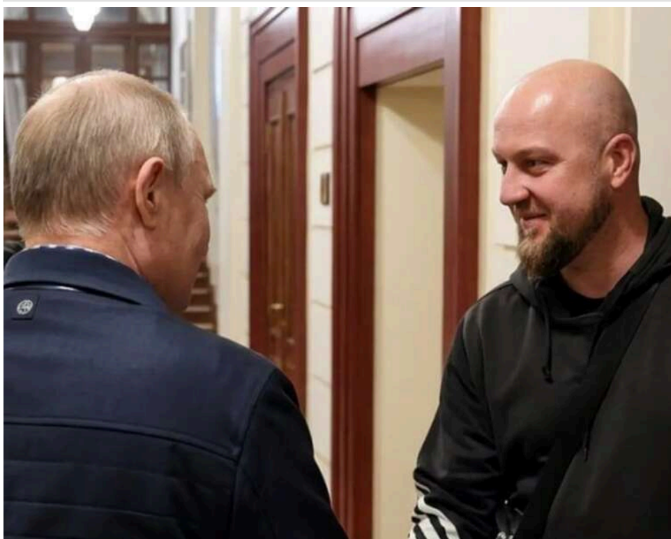
«Випадковий перехожий» з оточення Кабаєвої: Черговий конфуз Путіна з підставною особою

У Кремлі опублікували відео, як російський диктатор Володимир Путін спілкується з нібито випадковим перехожим, і омонфузилися. Оскільки виявилось, що цей чоловік – колишній співробітник компанії, яка управляла віллами Путіна та матері Аліни Кабаєвої.