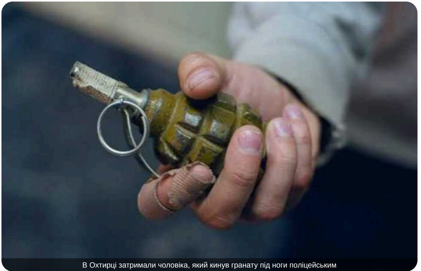
В Охтирці затримали чоловіка, який кинув гранату під ноги поліцейським

Суд обрав запобіжний захід жителю Охтирки, який кинув гранату під ноги працівникам поліції.