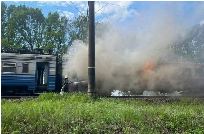
Фото: російський удар по потягу (t.me/dsns_telegram)