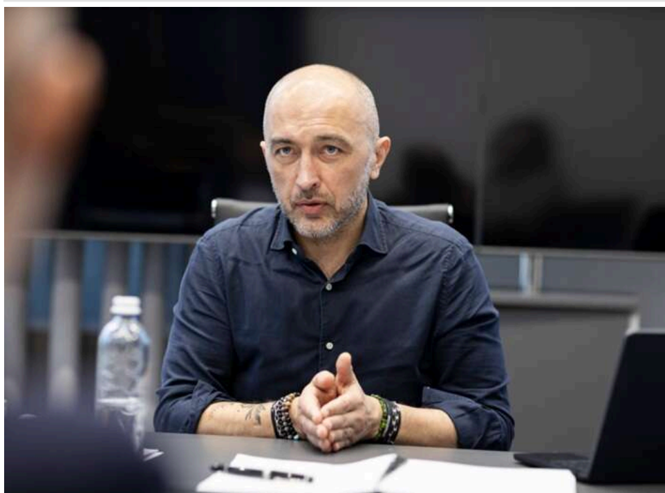
Ефект доміно: як кримінальна справа проти Єрмака може призвести до відставки голови НБУ Пишного

На тлі скандалу в Україні з кримінальною справою проти Єрмака у фінансових колах поширилися стійкі чутки про можливу швидку зміну керівника Нацбанку.