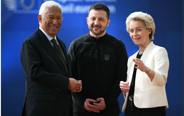
Фото: президент Євроради Антонію Кошта, президентка Єврокомісії Урсула фон дер Ляен та президент України Володимир Зеленський

Євросоюз розблокував для України кредитний пакет на 90 мільярдів євро.