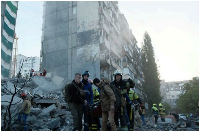
Фото: наслідки ворожої атаки на Київ