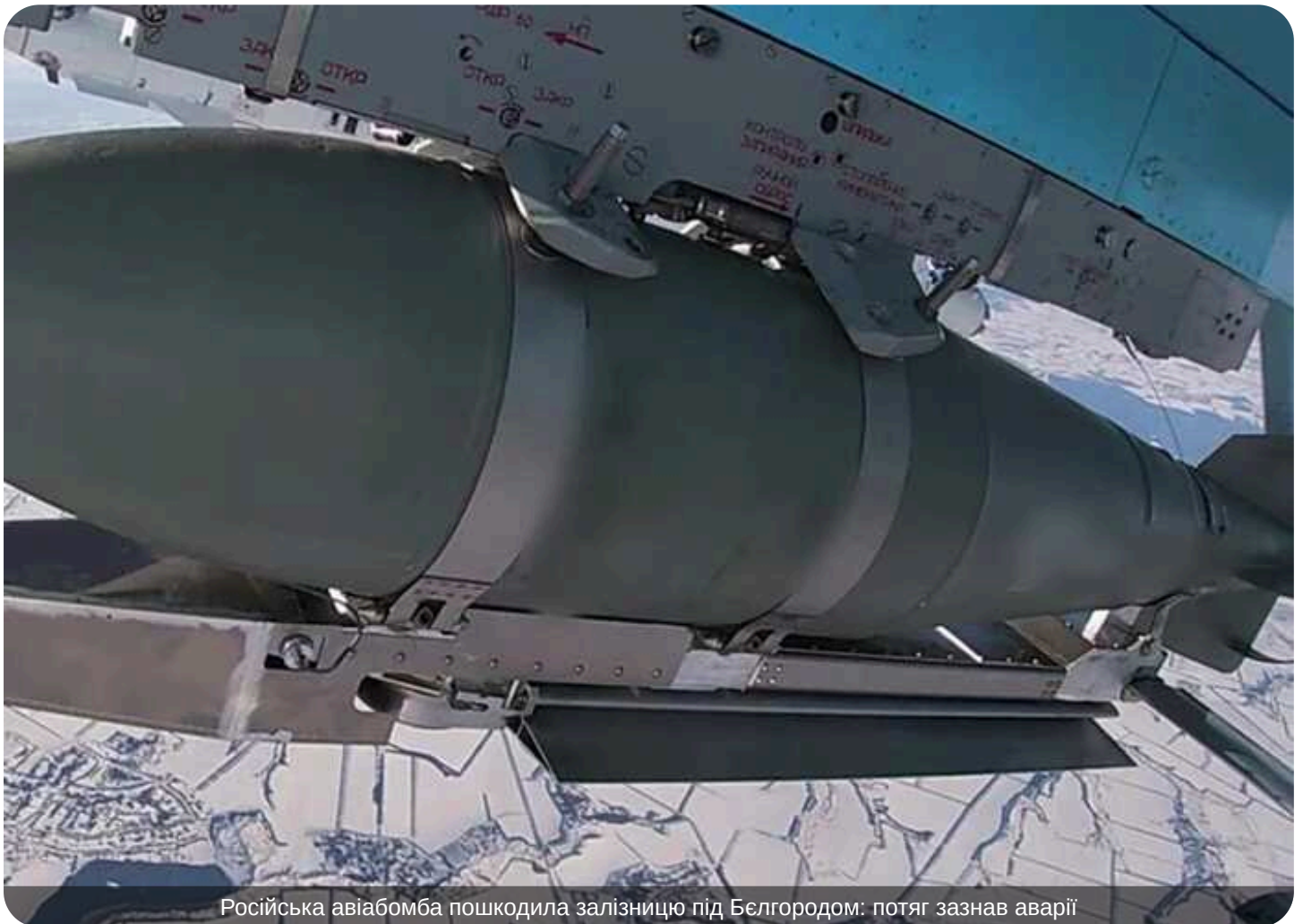
Російська авіабомба пошкодила залізницю під Белгородом: потяг зазнав аварії

Російський винищувач під час бойового вильоту впустив фугасну авіабомбу на залізничні колії в Яковлівському районі Белгородської області, що призвело до сходу електропоїзда з рейок.