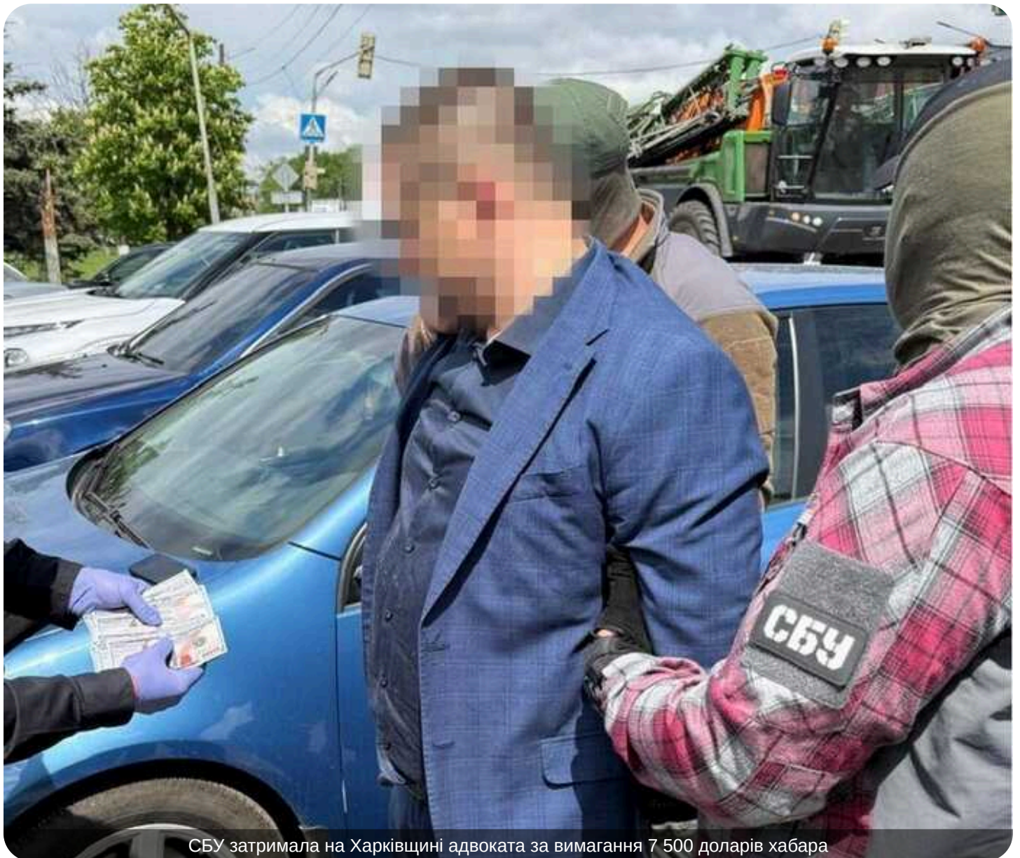
СБУ затримала на Харківщині адвоката за вимагання 7 500 доларів хабара

Служба безпеки затримала на Харківщині адвоката, який вимагав хабар у сумі 7 500 доларів США.