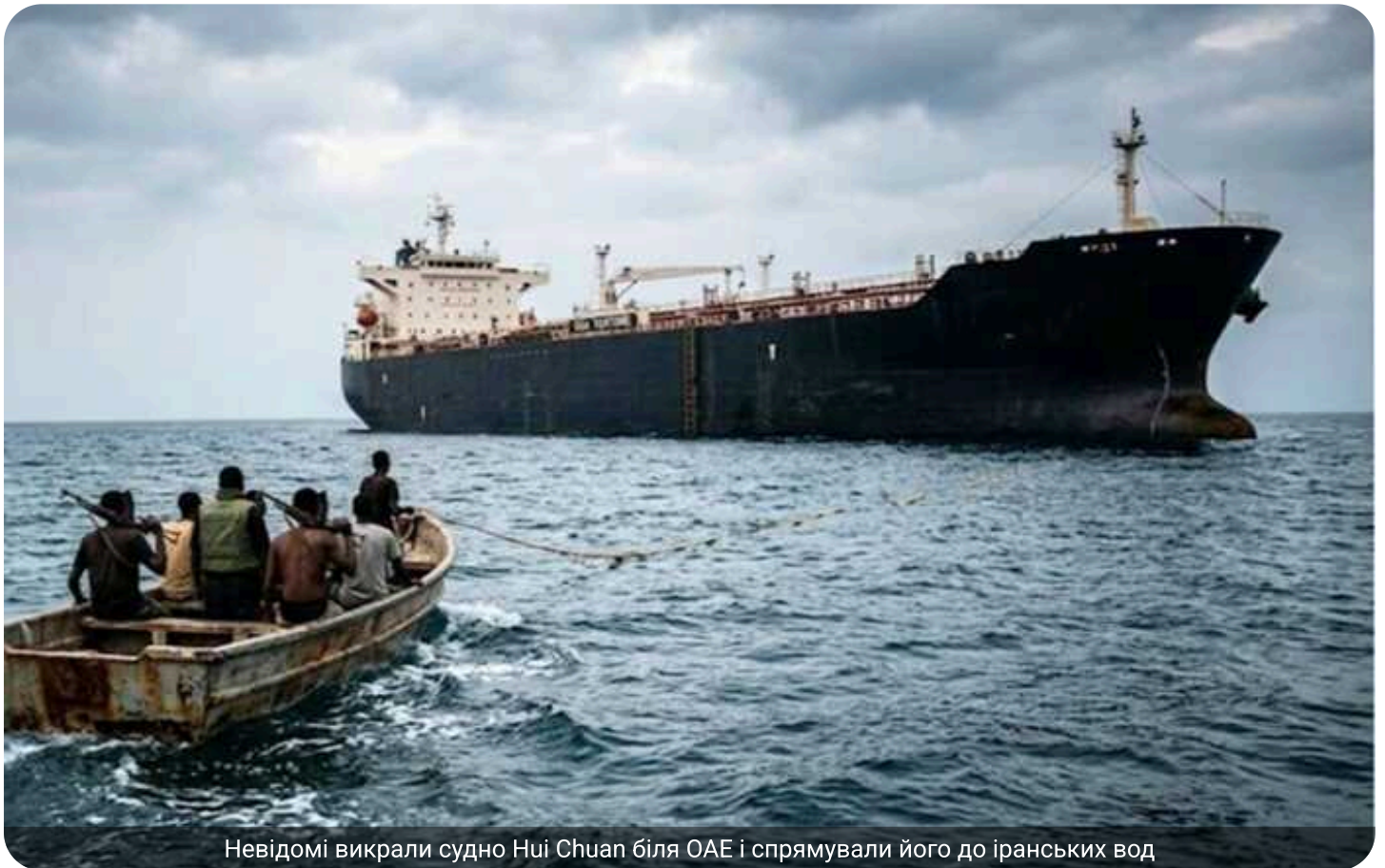
Невідомі викрали судно Hui Chuan біля ОАЕ і спрямували його до іранських вод

Біля узбережжя Об'єднаних Арабських Еміратів невідомі захопили судно, після чого відправили його в бік іранських вод.