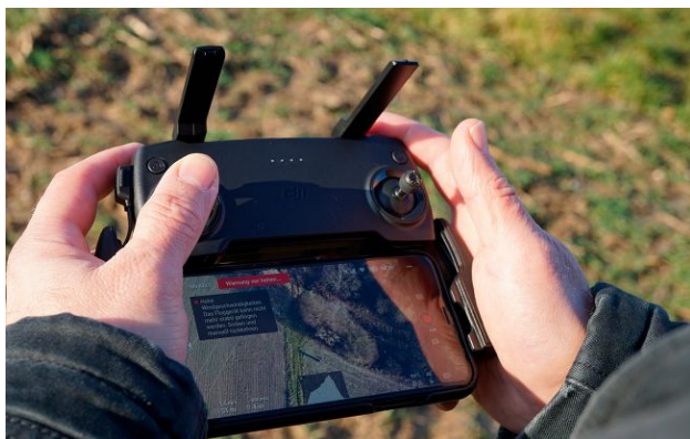
Фото: віддалене керування дронами (pixabay.com)

Україна розпочала системне масштабування технології віддаленого керування дронами-перехоплювачами, що дозволяє збивати ворожі цілі на відстані сотень і тисяч кілометрів від оператора.