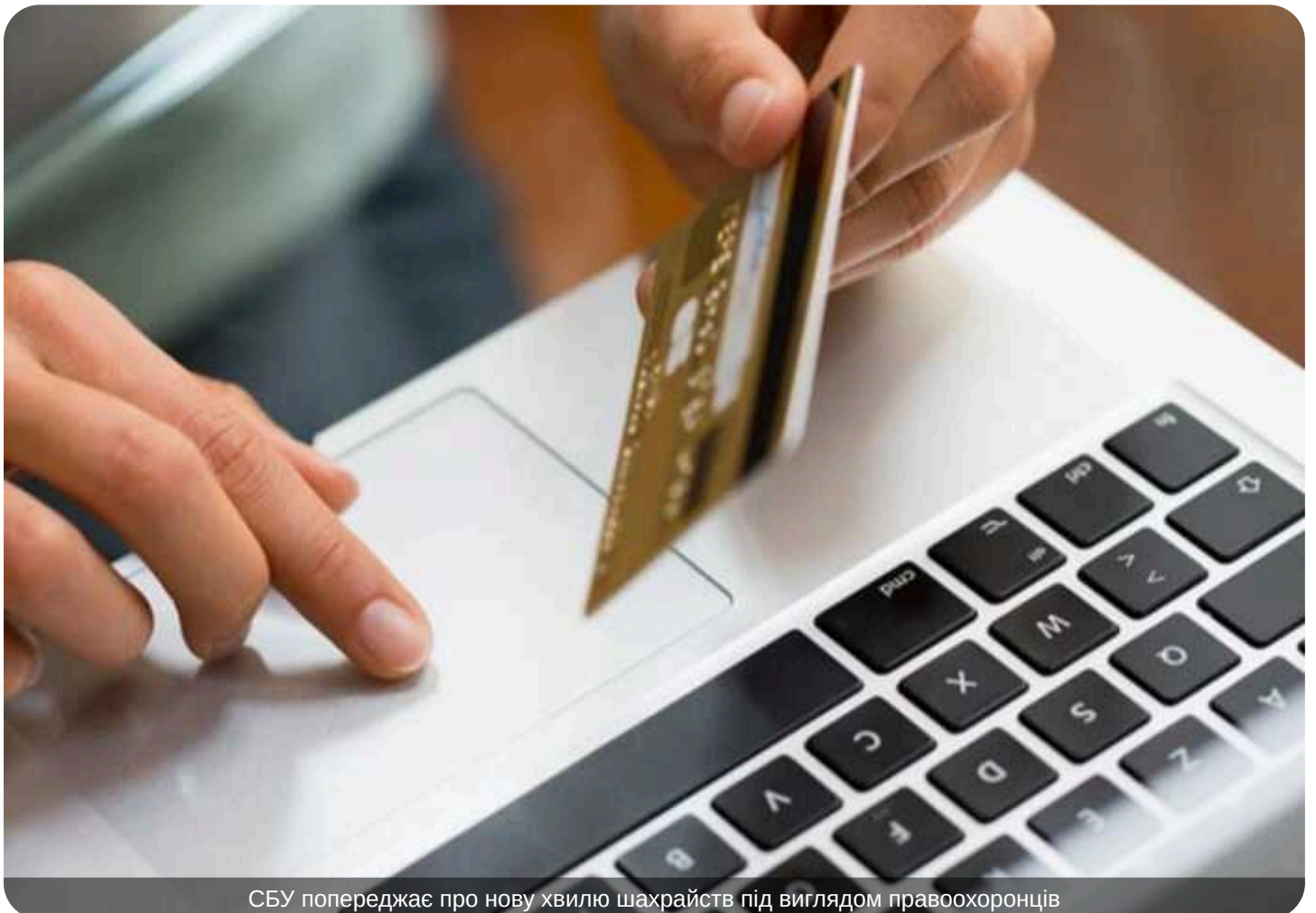
СБУ попереджає про нову хвилю шахрайств під виглядом правоохоронців

В Україні зросла кількість афер, під час яких зловмисники ошукують громадян, видаючи себе за працівників Служби безпеки та інших правоохоронних органів