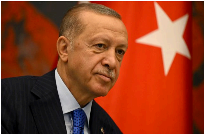
Фото: президент Туреччини Реджеп Тайїп Ердоган (Getty Images)