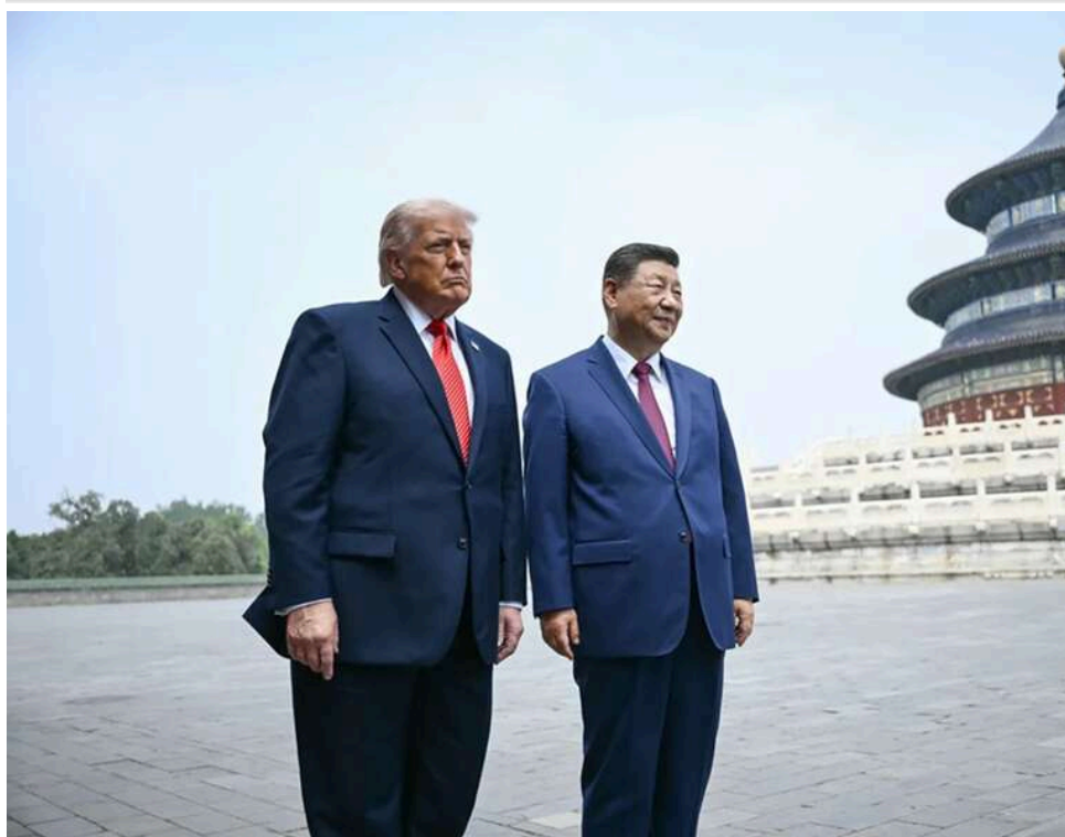
Китай та США прагнуть швидкого завершення війни в Україні, – Ван І за підсумками зустрічі Сі та Трампа

Китай і Сполучені Штати розраховують на якнайшвидше завершення війни в Україні та докладають «значних зусиль», щоб сприяти мирним переговорам. Про це після зустрічі голови КНР Сі Цзіньпіна з президентом США Дональдом Трампом заявив міністр закордонних справ Китаю Ван І, повідомляє Сінхуа .