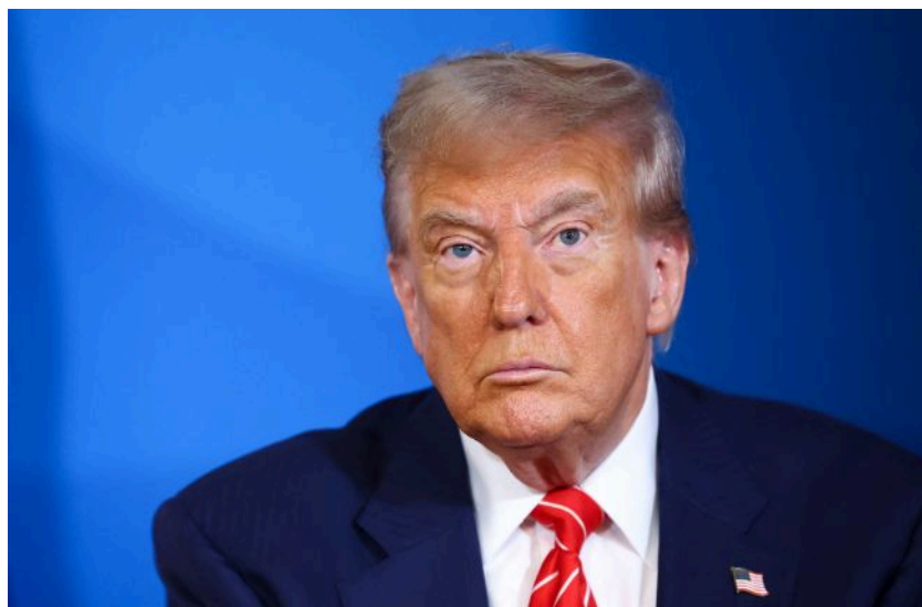
Фото: Дональд Трамп (Getty Images)