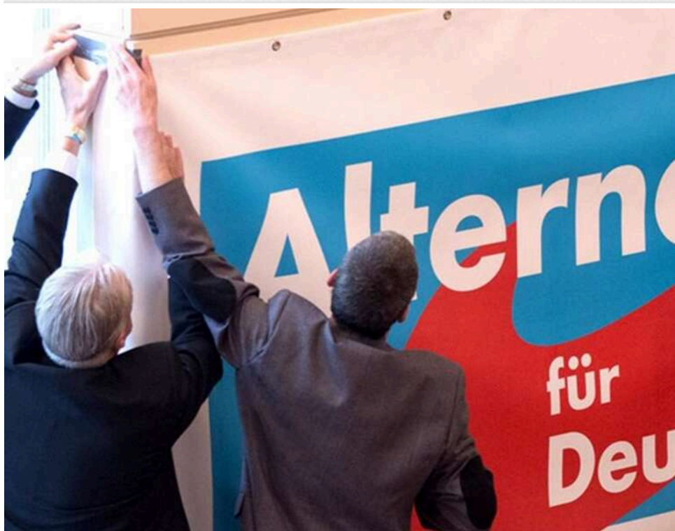
«Альтернатива для Німеччини» збільшує відрив від інших партій та досягла 29% підтримки, – опитування

Партія «Альтернатива для Німеччини», яка виступає проти підтримки України, продовжує нарощувати відрив від інших політичних сил, повідомляє Bild з посиланням на опитування інституту INSA.