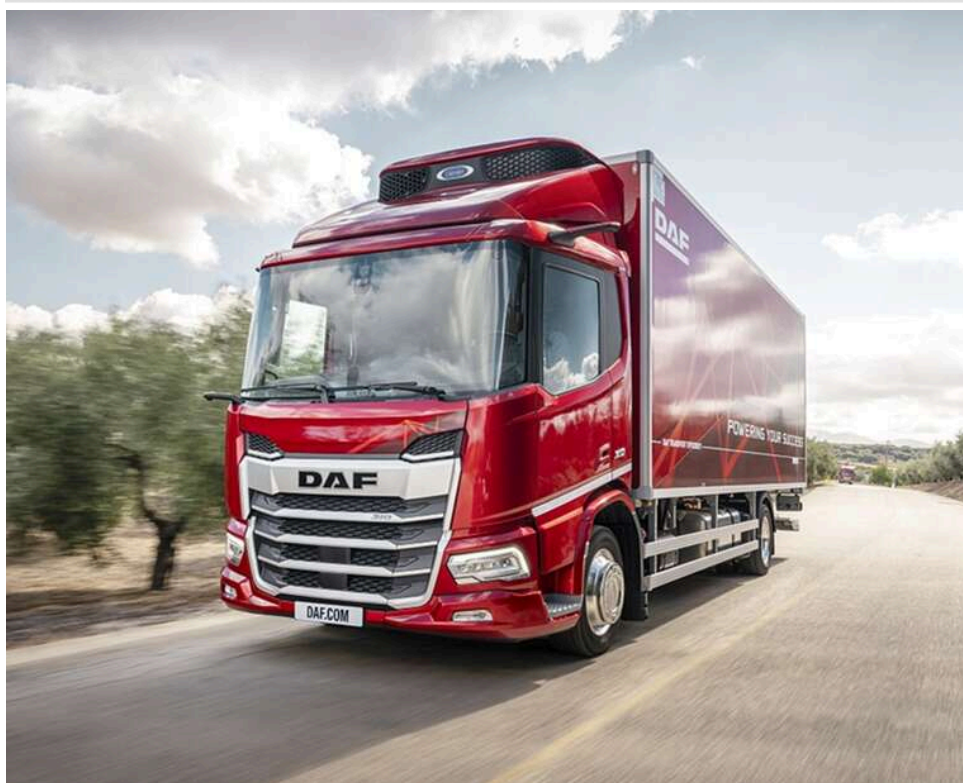
Контрабанда на 7,7 мільйона: суд на Львівщині оштрафував водія та конфіскував партію автомобільних плівок