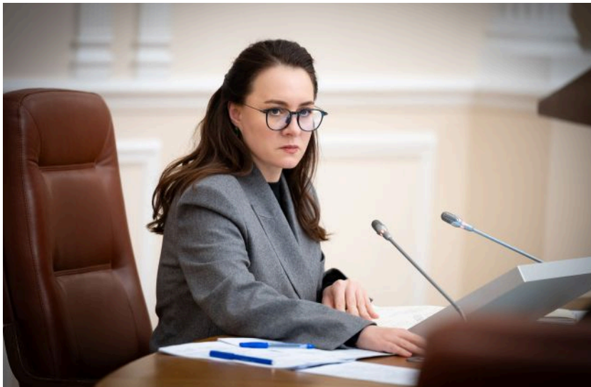
Фото: прем'єр-міністерка України Юлія Свириденко (facebook.com/KabminUA)