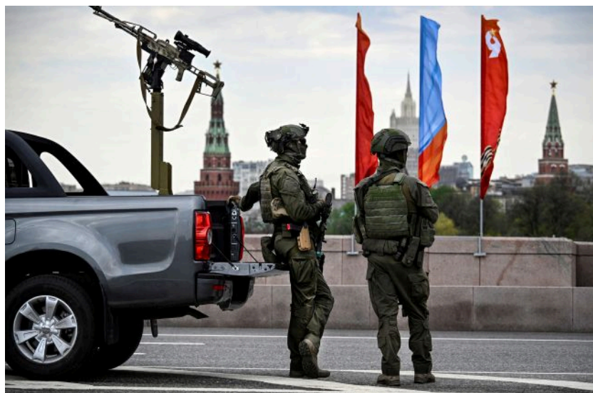
Фото: російські військові (Getty Images)