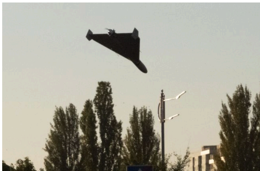
Фото: у Латвії знову попереджали про повітряну загрозу через невідомий дрон