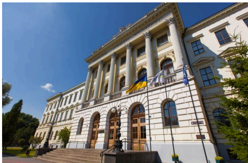
Торік понад 12 тисяч студентів Львівської політехніки пройшли практику