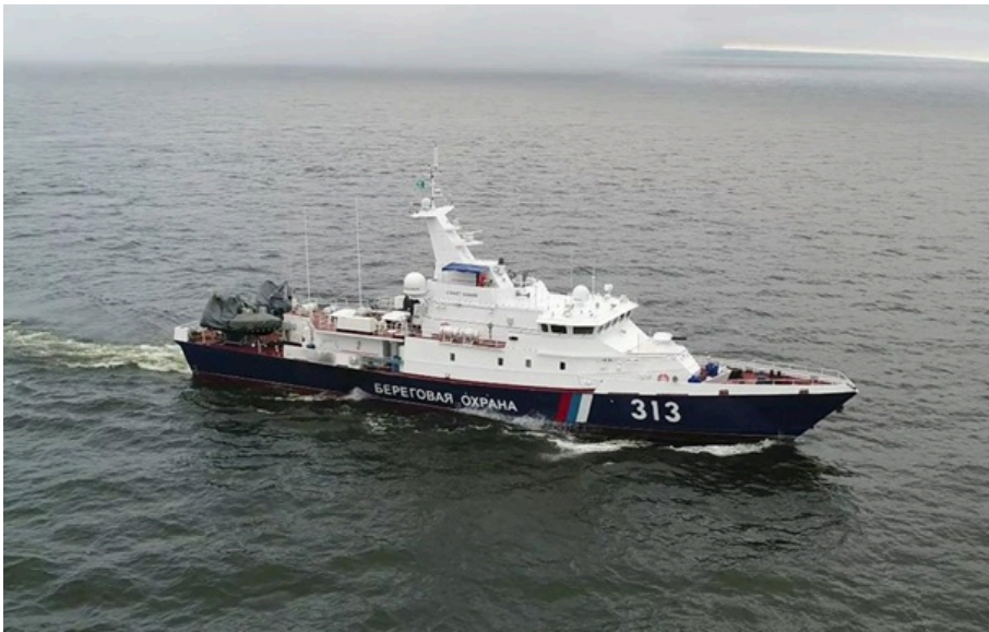
(ілюстративне фото) Російський прикордонний сторожовий корабель проекту 10410