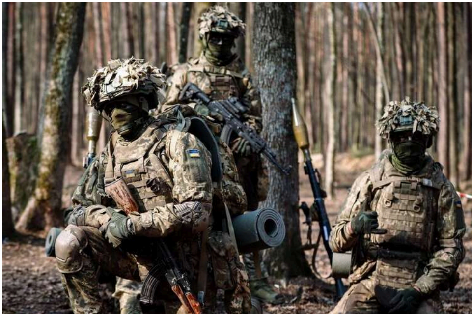
Спецоперація СБУ: ЦСО «Альфа» уразив оборонний завод та НПЗ у Підмосков'ї, а також ППО на аеродромі «Бельбек»

Фахівці Центру спеціальних операцій «Альфа» Служби безпеки України спільно з іншими підрозділами Сил оборони завдали ударів по низці об'єктів у Московській області РФ та в тимчасово окупованому Криму.