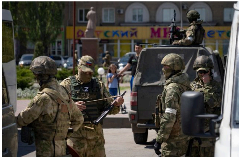
Фото: окупанти масово вилучають рушниці на ТОТ (Getty Images)