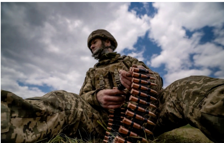
Українські війська виснажують росіян вздовж усієї лінії бойового зіткнення