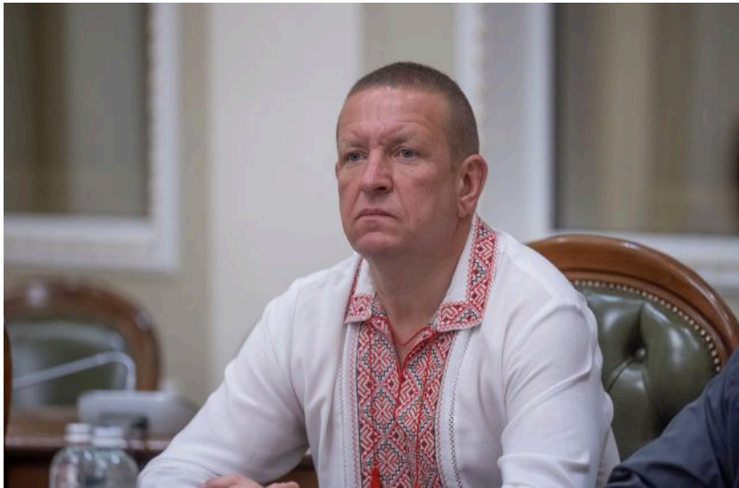
Народний депутат України Михайло Бондар