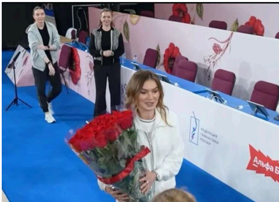
Бунт у російській гімнастиці: тренери та судді повстали проти засилля «протеже» Аліни Кабаєвої

Залаштунки російської художньої гімнастики перетворилося на поле інформаційної війни, де тренери, судді та батьки спортсменок відкрито бунтують проти засилля фавориток Аліни Кабаєвої.