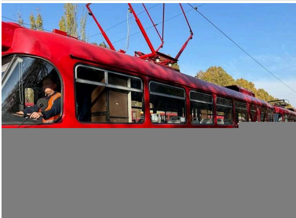
У Дніпрі витратять понад 1,8 мільйона гривень на обклейку трамваїв: тендер виграла єдина учасниця

Комунальне підприємство «Дніпровський електротранспорт» Дніпровської міської ради замовило послуги з обклейки трамвайних вагонів.