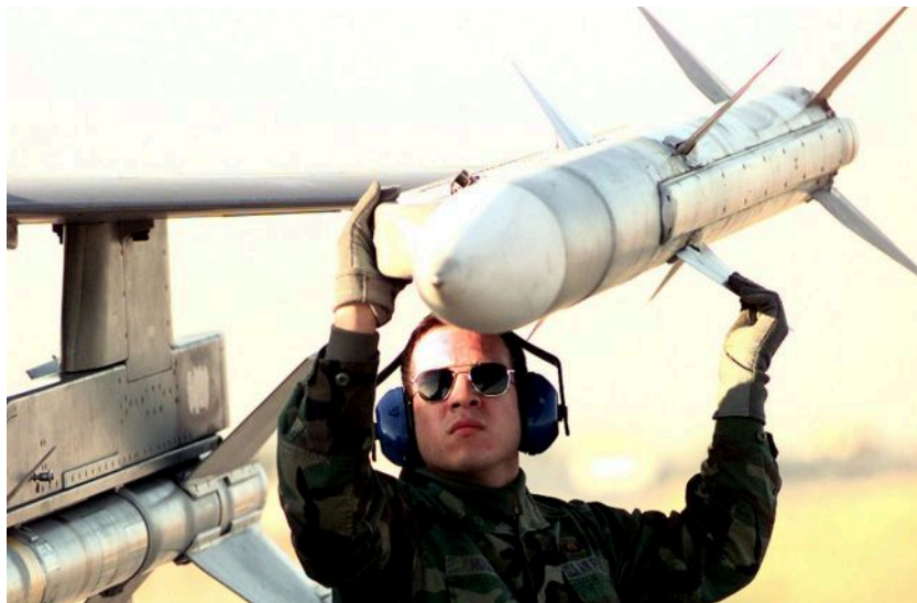
Фото: Фінляндія підіймала винищувачі для пошуку невідомих дронів