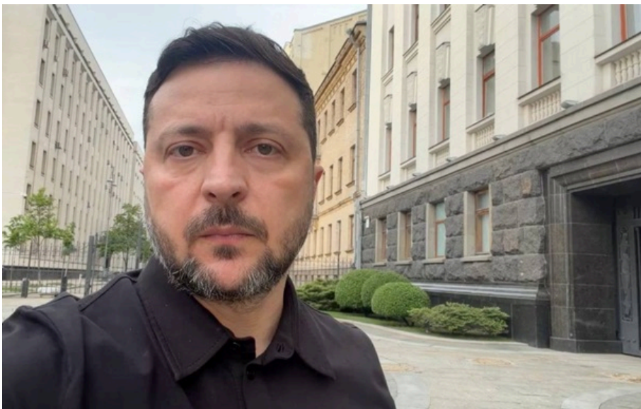
Зеленський заявив про успіхи ЗСУ на фронті

За сьогодні показники активності такі, що наших активних дій за добу - більше, ніж російських, зазначив президент.