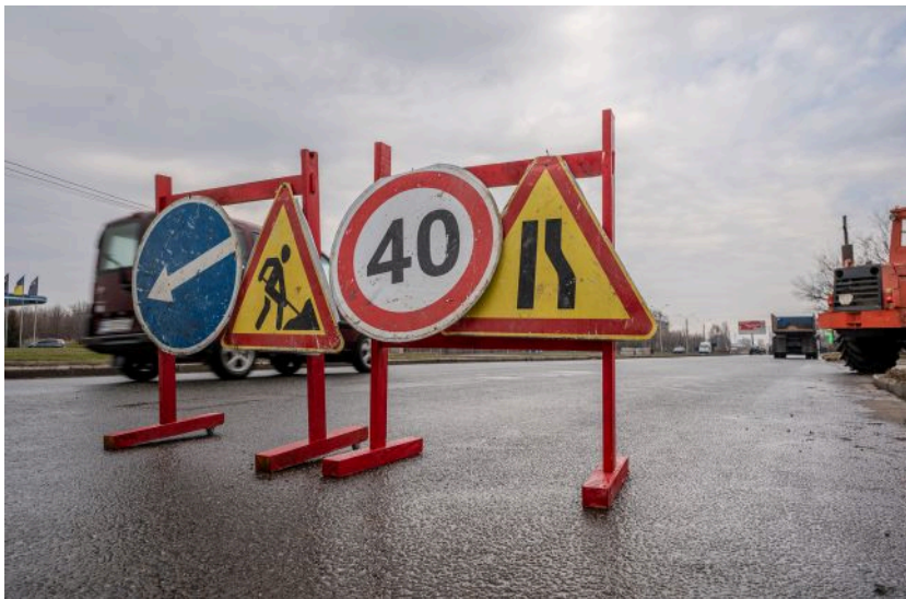
Фото: ремонт доріг у Києві змінить рух транспорту