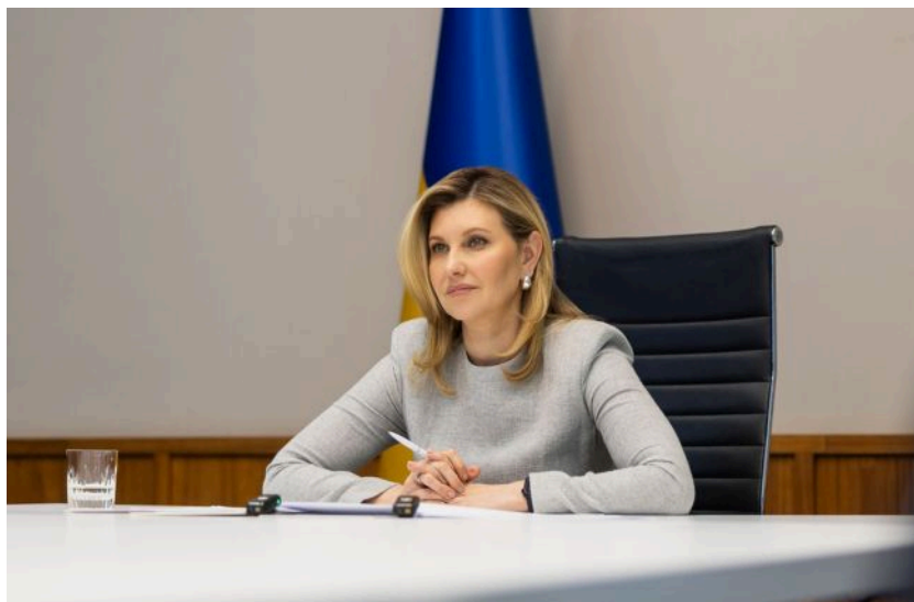
Фото: дружина президента України Олена Зеленська (Getty Images)