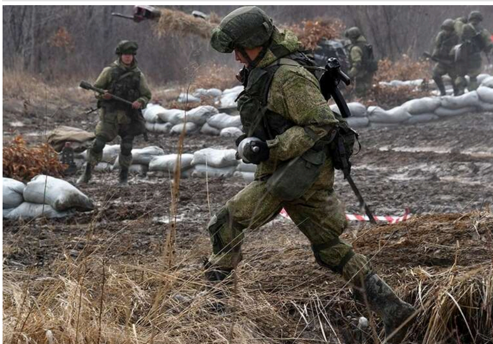
Ситуація на фронті: від початку доби сталося 195 бойових зіткнень, ворог випустив понад 200 КАБів

Від початку доби на фронті сталося 195 бойових зіткнень. Також ворог завдав 76 авіаційних ударів, скинув 201 керовану авіабомбу. Крім того, залучив для ураження 4851 дрон-камікадзе та здійснив 1994 обстріли населених пунктів і позицій наших військ.