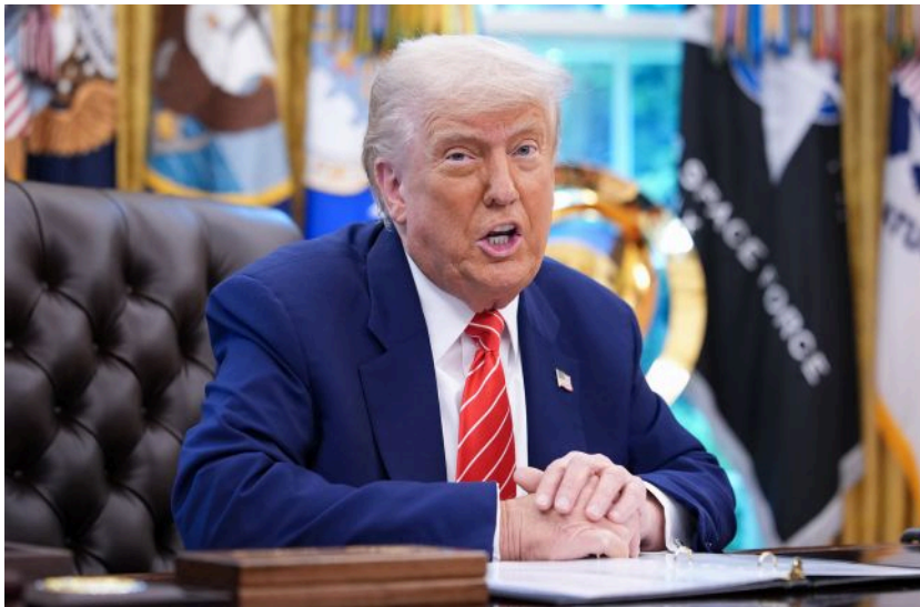
Фото: Дональд Трамп (Getty Images)