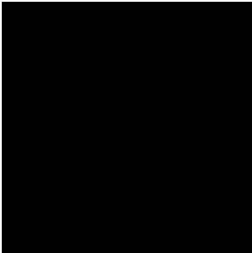
Фото: курс валют на 18 травня (інфографіка РБК-Україна)

Євро в обмінниках сьогодні можна купити за середнім курсом у 51,69 (-4 коп) гривень, а здати - по 51,45 (-5 коп) гривні.