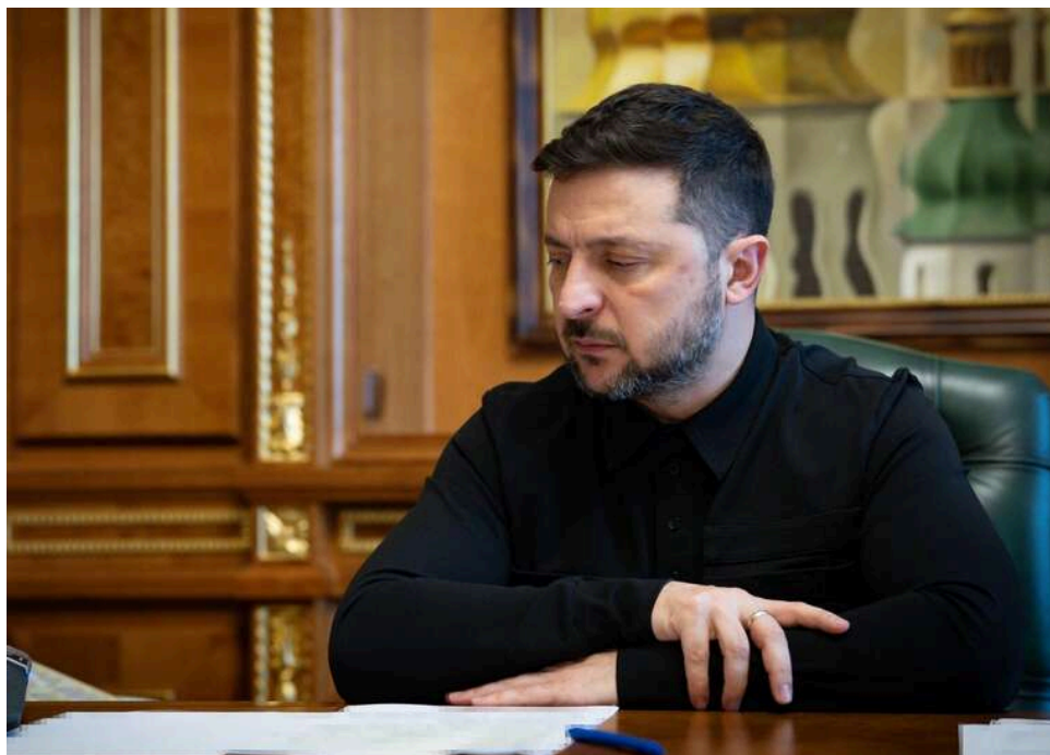
Зеленський заявив про удар РФ по «китайському судну» в Одесі: у ВМС уточнили, кому насправді належить корабель

Зеленський також стверджує, що російські сили вночі під Одесою завдали удару по китайському судну.