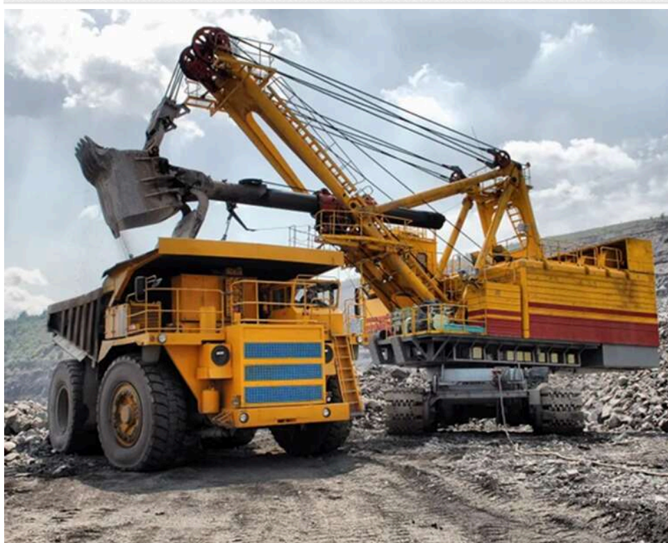
Справа «Інком Техніка»: СБУ викрила канал експорту українського обладнання на російські шахти