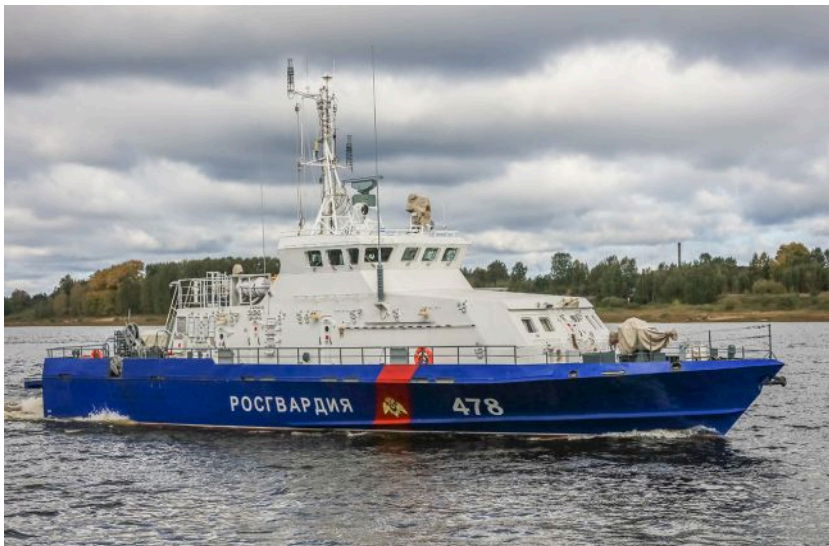
Фото: Сили оборони вдарили по цілях в Дагестані, Криму та окупованих регіонах