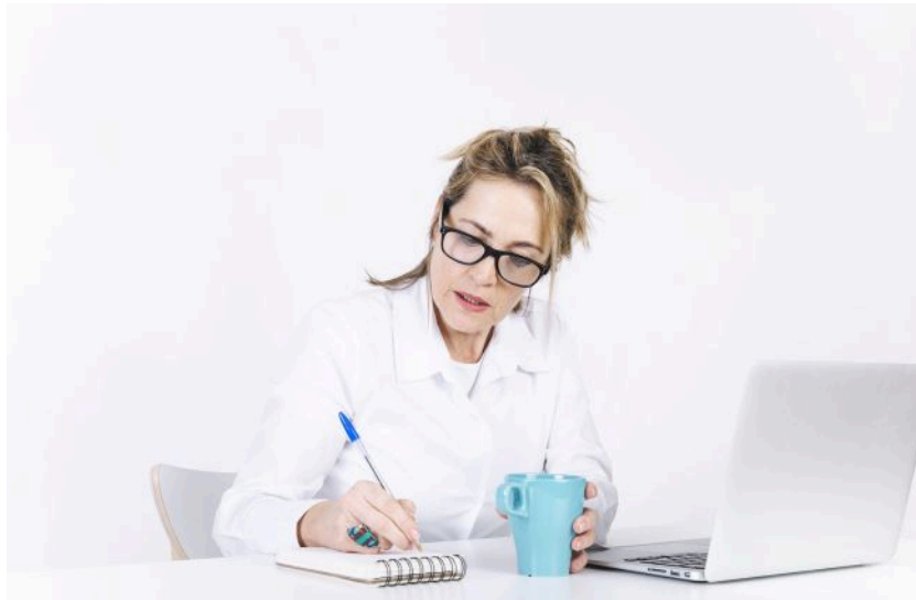
Вчені ризикують втратити професійну репутацію через ШІ