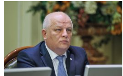
Помер народний депутат Степан Кубів