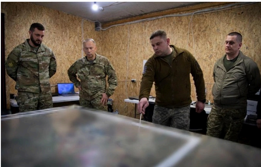
Олександр Сирський під час поїздки на Південно-Слобожанський напрямок

За першу половину травня противник здійснив на цьому напрямку понад 150 атак, зазначив головком..