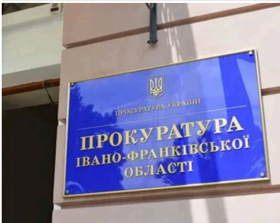
НАБУ і САП завершили розслідування справи експрокурорів Івано-Франківщини Хими та Мігашука

НАБУ та САП завершили досудове розслідування у кримінальному провадженні за підозрою колишнього керівника Івано-Франківської обласної прокуратури Романа Хими та ексначальника управління нагляду за додержанням законів цієї прокуратури Мар'яна Мігашука в одержанні неправомірної вигоди.