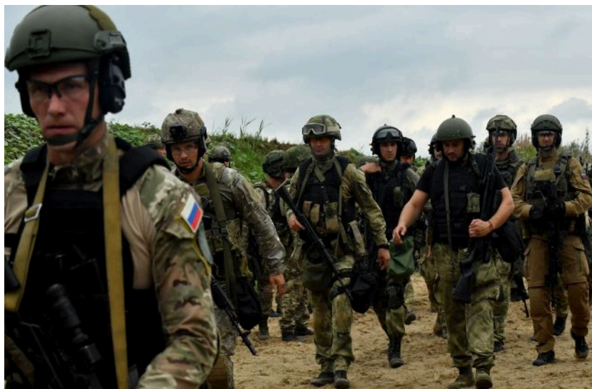
Ілюстративне фото: з'явилися чутки про активізацію РФ у Чернігівській області