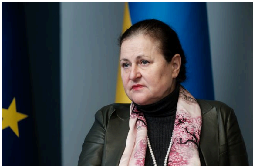
Фото: Катеріна Матернова (Віталій Носач, РБК-Україна)