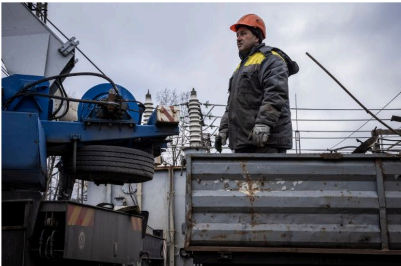
За тиждень ДТЕК повернув світло 318 тисячам родин після обстрілів