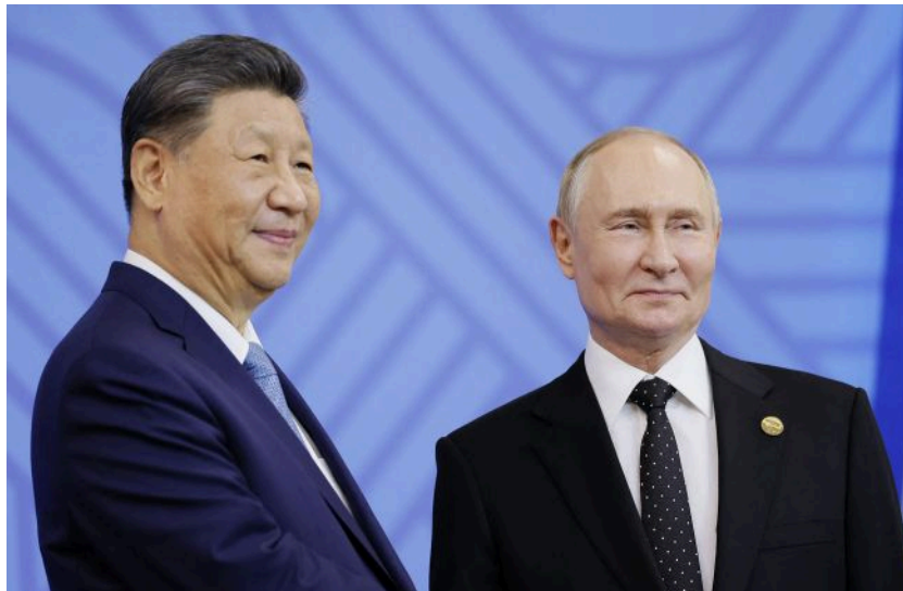
Фото: лідер Китаю Сі Цзіньпін та російський диктатор Володимир Путін