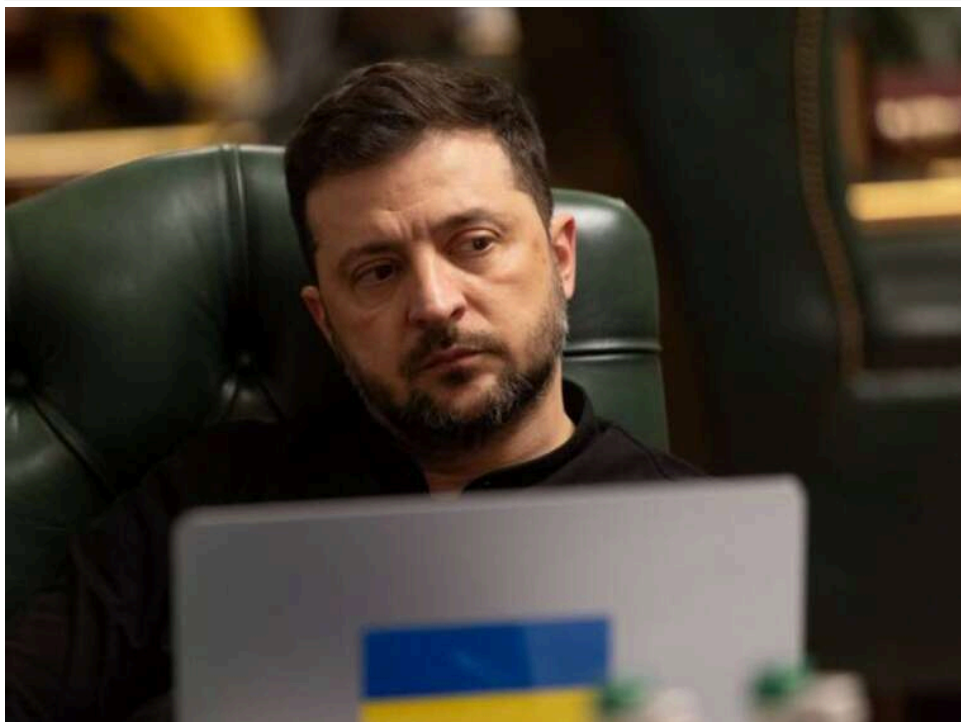
Зеленський: Українська розвідка отримала російські документи про зниження нафтовидобутку та перероблення в РФ

Українська розвідка отримала російські документи з новими оцінками втрат країни-агресорки від війни. Згідно зі свіжими даними у РФ зафіксовано зменшення кількості активних нафтових свердловин на близько 4 сотні та скорочення нафтоперероблення щонайменше на 10 %.