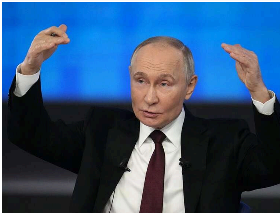
Путін не відмовиться від війни, а розмови про загрозу його владі всередині РФ є «видаванням бажаного за дійсне», - Reuters

Анонімний глава розвідки однієї з європейських країн заявив Reuters, що Путін не має наміру відмовлятися від своїх військових цілей, а його владі всередині РФ ніщо не загрожує.