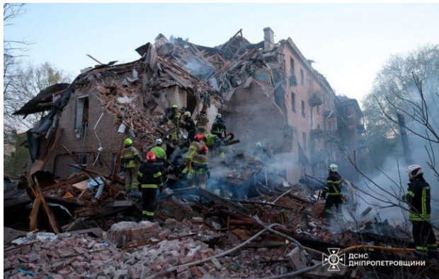
Фото: наслідки обстрілу Дніпра 25 квітня

У ніч на 25 квітня російські окупанти завдали серії ударів по Харкову, Дніпру, Сумській, Київській та Запорізькій області.