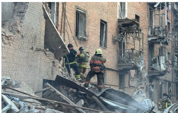
Фото: у Дніпрі внаслідок удару РФ є загиблі

Внаслідок російського удару по багатоповерхівці у Дніпрі вночі 25 квітня загинули дві людини. Під завалами ще можуть перебувати 5 людей.